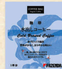
水出しコーヒー10g 6袋×3箱計18杯分 3,400円(税別)