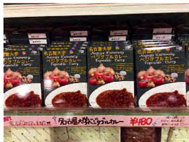
名古屋大学生協様 店頭販売風景