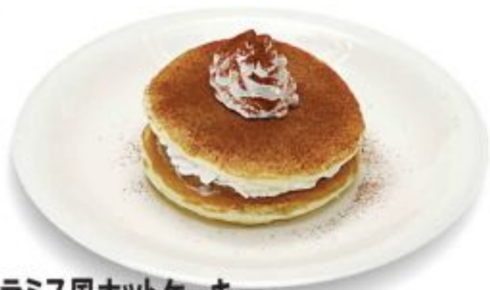
ティラミス風ホットケーキ