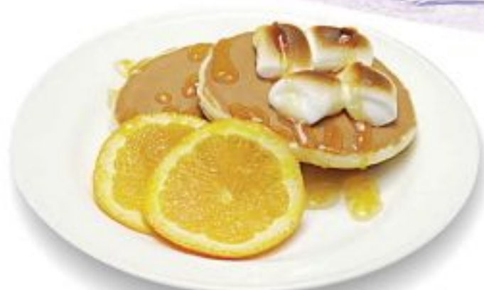
フルーツフレ風ホットケーキ