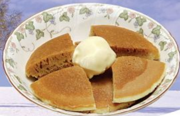
ホットケーキ・アフォガード