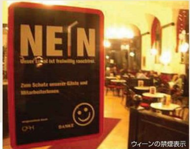
ウィーンの禁煙表示